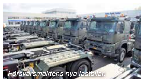
Försvarets nya lastbilar.