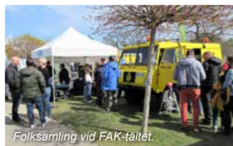
Folksamling vid FAK-tältet.