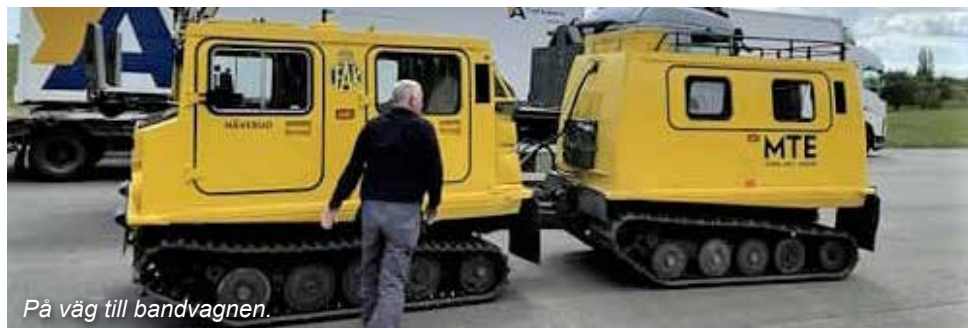
På väg till bandvagnen.