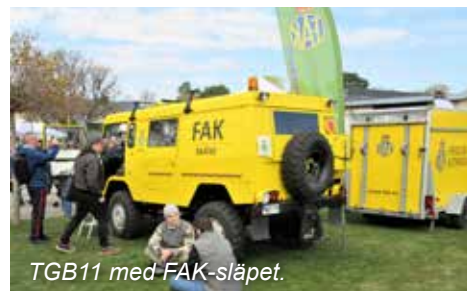
TGB11 med FAK-släpet.