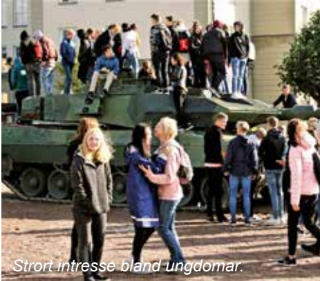
Stort intresse bland ungdomar.