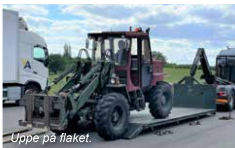
Upe på flaket.

Den introduktionsutbildning som genomfördes på Husie övningsområde den 13 maj hade samlat 28 intresserade deltagare. Utöver egna fordon hade en civil lastbil med släp och en buss hyrts in. Enligt FAK-instruktörerna var antalet deltagare för många för att få en effektiv övning.