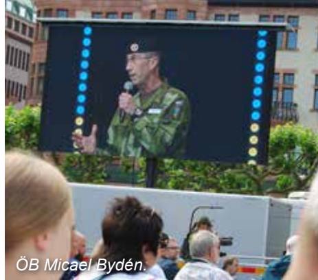
ÖB Micael Bydén.