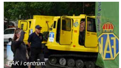
FAK i centrum.