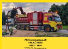
PR Skåningslag AB FALKÖPING 0515-13846 WWW.PR-SKÅNINGSLAG.SE