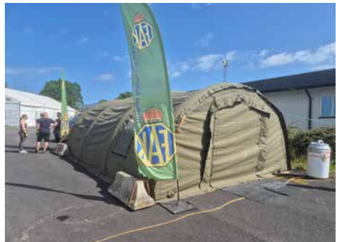
FAKs bas på festivalen var ett Sjukvårdstält 4.