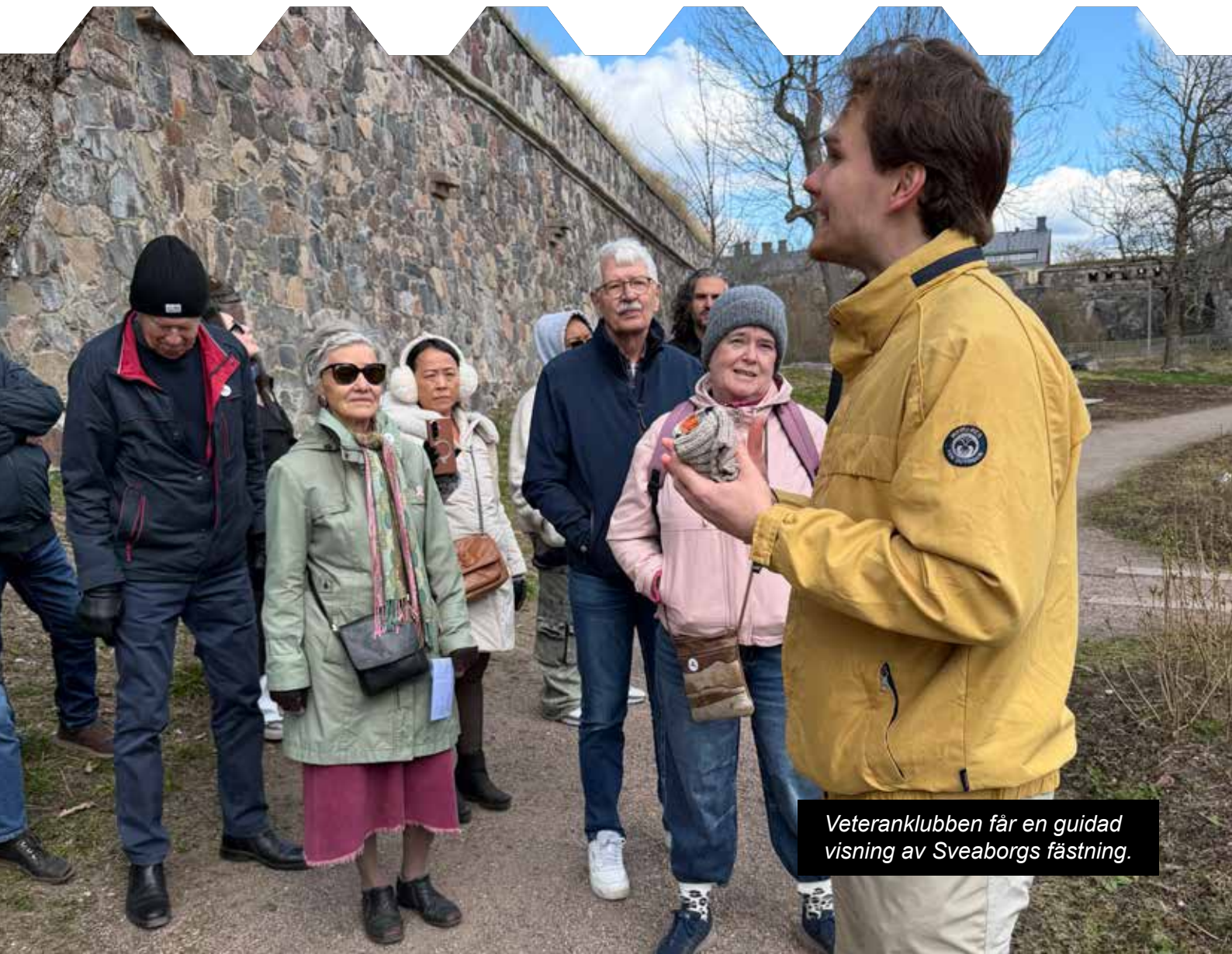
Veteranklubben får en guidad visning av Sveaborgs fästning.

Förhoppningen är att aktivera Veteranklubben så att fler nya veteraner kan bli medlemmar och kan träffas vid många tillfällen framöver.