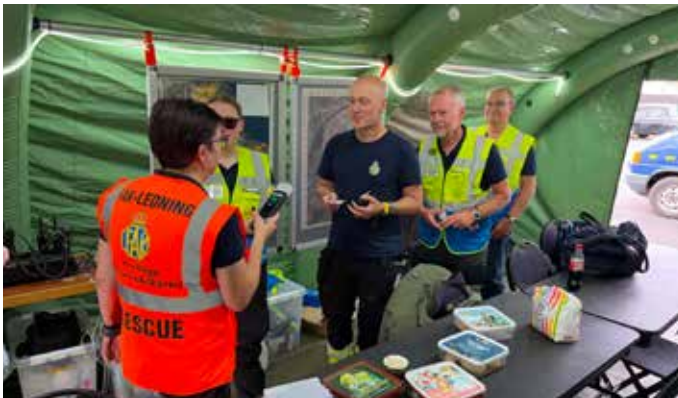
FAK håller hårt på säkerheten. Inför varje pass får alla blåsa alkomätare och visa körkort.

– I år var det lite brist på sovplatser så vi köpte in en gammal husvagn som vi kallar "FAK Hilton". Den kommer vi även att kunna använda för andra insatser som stab och värmestuga.