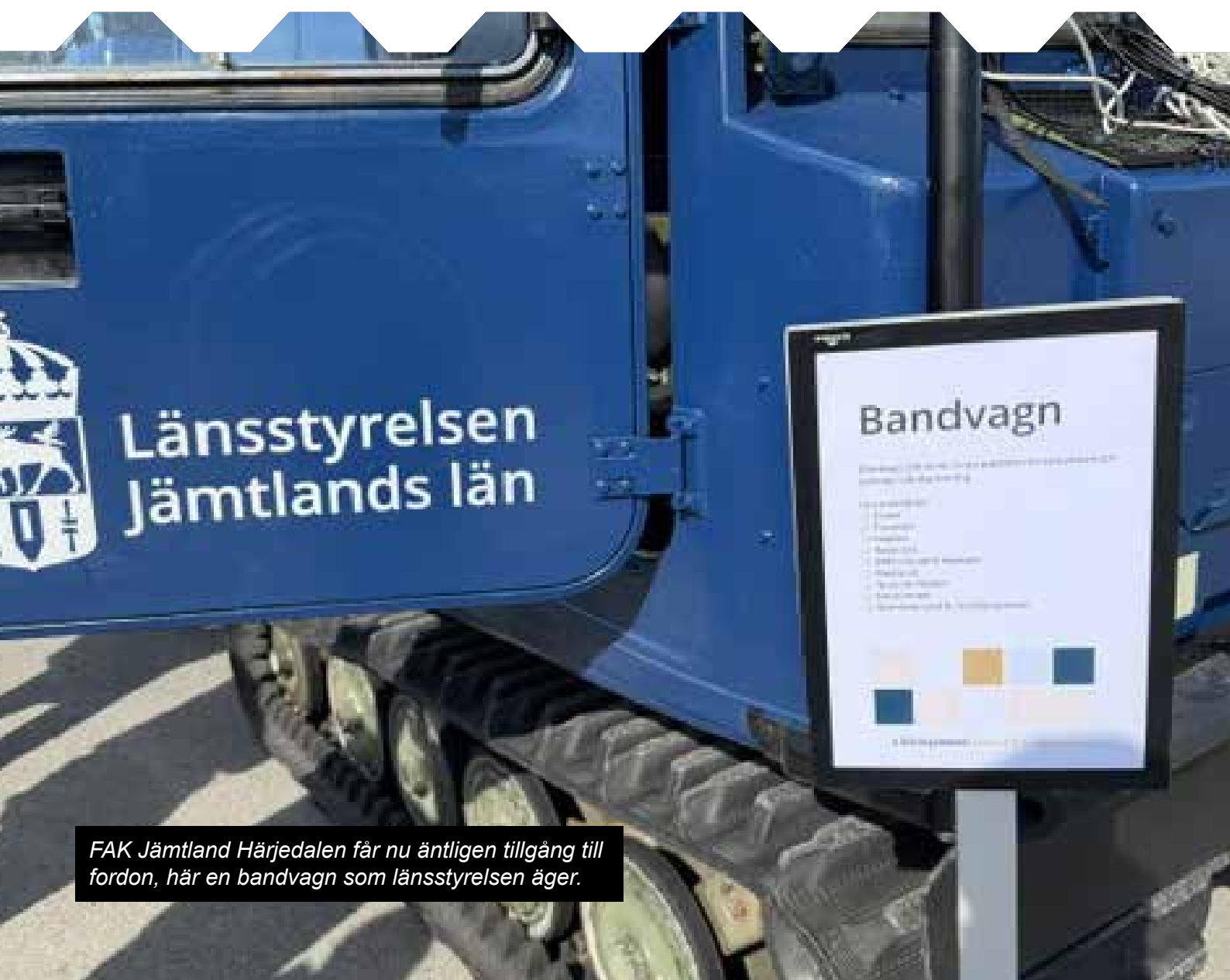
FAK Jämtland Härjedalen får nu äntligen tillgång till fordon, här en bandvagn som länsstyrelsen äger.