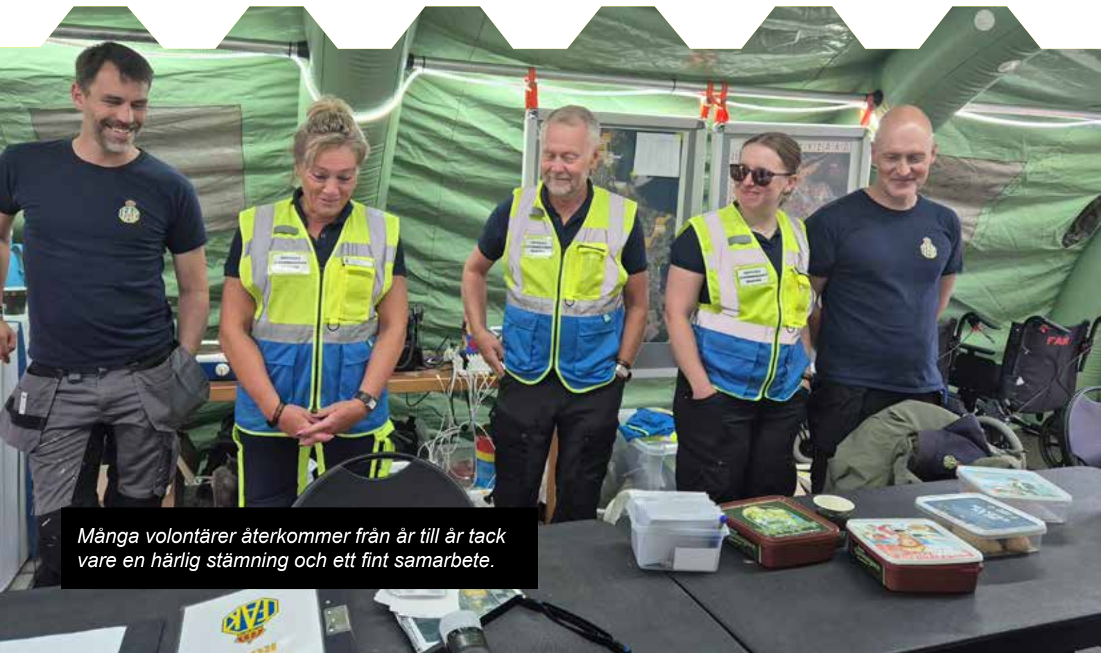
Många volontärer återkommer från år till år tack vare en härlig stämning och ett fint samarbete.